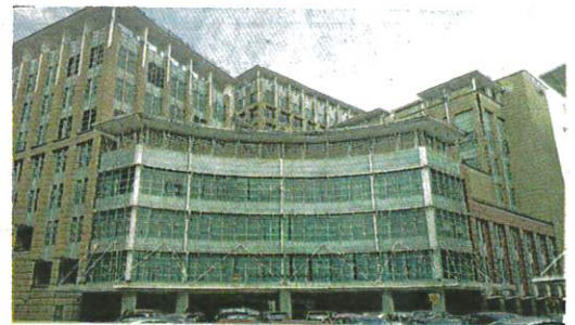
SISTEM e-Pharmacist KKM ditutup sementara bagi membolehkan pasukan ICT menangani masalah teknikal yang berlaku.

Sehubungan itu, KKM membuat keputusan untuk menutup sementara capaian ke sistem berkenaan bagi menangani situasi itu secara berhemah dan berlaku adil kepada semua calon yang memohon.