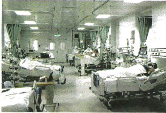
PELAKSANAAN short stay ward akan diperkenalkan bagi mengatasi kesesakan wad di hospital kerajaan. – GAMBAR HIASAN

"Kementerian melalui Program Perubatan, Program Kesihatan Awam dan Program Penyelidikan dan Sokongan Teknikal di bawah Timbalan Ketua Pengarah masing-masing diminta me-