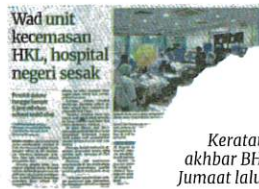
Keratan akhbar BH, Jumaat lalu.

"Insya-Allah, kita perlu sedikit masa lagi untuk audit dilengkapkan dan diteliti, termasuk dalam