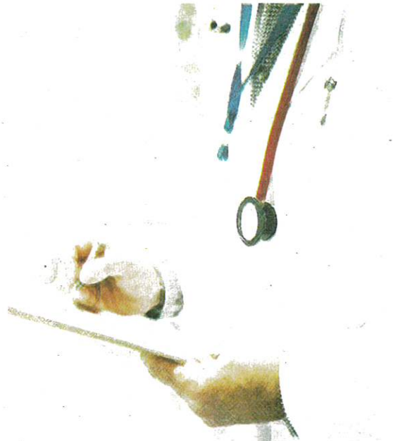
MMA mahu kriteria pemilihan doktor ke jawatan tetap diumumkan secara terbuka. (Foto hiasan)

Doktor berkenaan juga seharusnya pernah bekerja di di Sabah, Sarawak selaras janji KKM memberi keutamaan kepada dua negeri itu serta menggalakkan