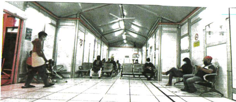
Outpatients waiting at Hospital Kuala Lumpur yesterday. Malaysia's cumulative Covid-19 infections from Jan 25, 2020, to Jan 21, 2023, stood at 5,034,521.